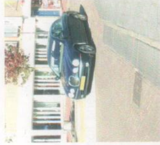
rechttdoor op linkerbaan

Van de obstakels die een rode stip van afkeuring hebben gekregen, zijn het vooral de punaises die de toets niet kunnen doorstaan. Verkeersveiligheid gaat verder dan alleen maar de snelheid eruit halen. Waar de gemeente geen oog voor heeft, is dat die punaises verkeerd en onveilig rijgedrag van zowel automobilisten als fietsers in de hand werken. Daarmee zijn die locaties verkeersveiliger geworden en dat is beslist niet de bedoeling van het VCP geweest.