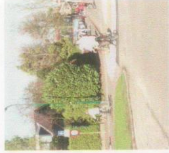
links de bocht afsnijden

De meest kritische punten zijn de Kalverstraat (bij Eskes) en - vooral - de veranderde situatie