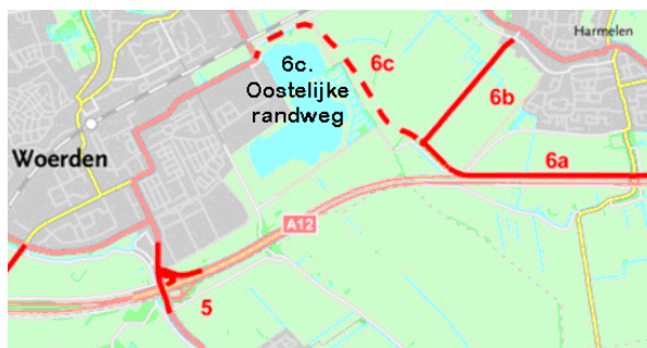
6c. Oostelijke randweg geschrapt “Als de weg niet nodig is moet je die niet aanleggen”

- De aanleg van nieuwe bedrijventerreinen. Wij vinden die onnodig. Waarom is volledig na te lezen in de bijgevoegde zienswijze. Van de werkgroep geen Windmolens bij Woonwijken (ooit vanuit ons uit geïnitieerd) is ook de zienswijze bijgevoegd.