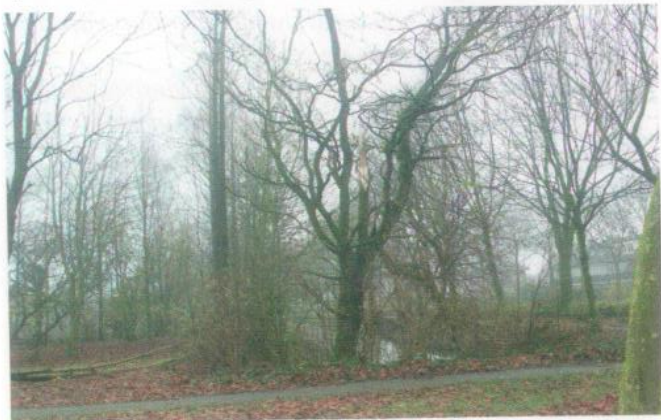
Een plataan in het Koningspark die - net als bij andere reeds gekapte bomen het geval was - best kan blijven behouden

De gemeente heeft een behoorlijke inspanning verricht door de omgewaaide bomen op te ruimen. Niets dan lof hiervoor. Maar in het spoor daarvan gebeurden zaken die niet helemaal correct zijn. Een behoorlijk aantal bomen met stormschade is blijven staan. Sommige daarvan leverden dreiging op om bij enige storm ook om te gaan. De gemeente kan zich niet permitteren daar risico mee te lopen en heeft die gekapt. Daar is niets mis mee. Maar beschadigde bomen die ons inziens geen dreiging opleverden, zijn ook gekapt. En daarvoor, dat is inmiddels door de gemeentesecretaris per e-mail bevestigd, moet de kapvergunningproce-