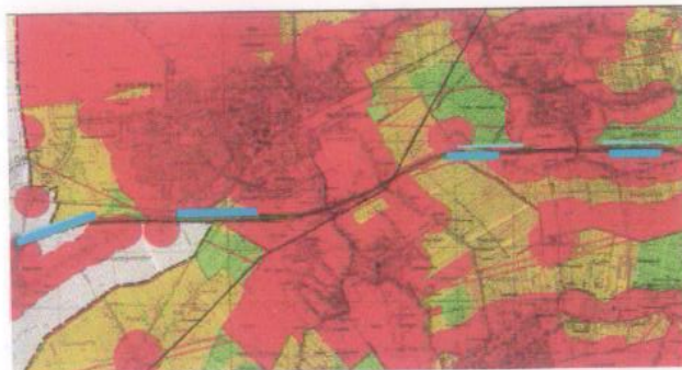
... de blauwe — stroken zijn de genoemde locaties...

Op de publicaties n.a.v. ons persbericht over windmolens hebben wij veel spontane reacties gehad. Men kan niet geloven dat de gemeente zal toestaan dat er van die grote windmolens zo vlak op de bebouwing komen te staan. In het plan van de Provincie zijn oostelijk van de kern Harmelen 4 stuks en westelijk ervan 6 stuks (!) genoemd, maar ook bij de kern Woerden zelf zijn locaties vermeld.