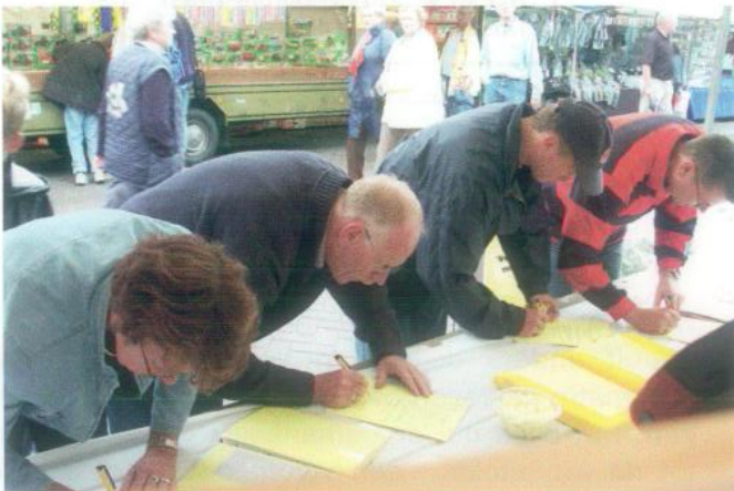
De gehele dag door was het druk met petitie's ondertekenen.

Dat er voor het plaatsen van windmolens bij woonwijken nauwelijks draagvlak bestaat, blijkt ook uit het feit dat er op de jl. Septembermarkt 322 petitie's tegen de plaatsing van windmolens bij woonwijken zijn getekend.