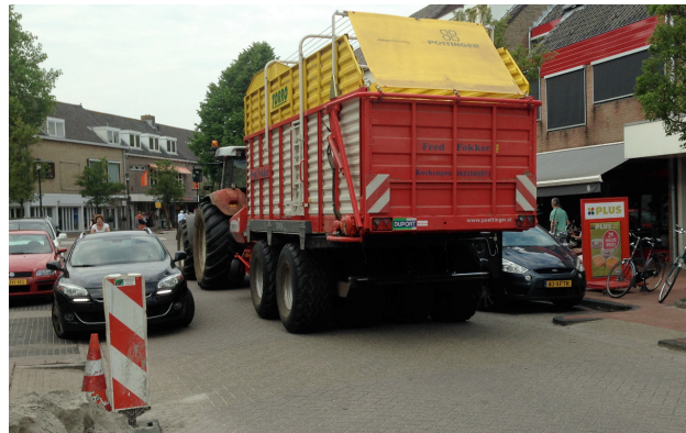
Alles moet wijken in de Kalverstraat in Harmelen voor de zware tractor-combinaties

De bijgevoegde foto geeft duidelijk aan dat de straten in Harmelen niet bedoeld zijn voor zwaar verkeer. Om het verkeer uit de kernen te weren gaat dit jaar de randweg open. Alleen zou hier over een bepaald deel geen tractorverkeer mogen rijden. Dit bevremdt Inwonersbelangen omdat de randweg bedoeld