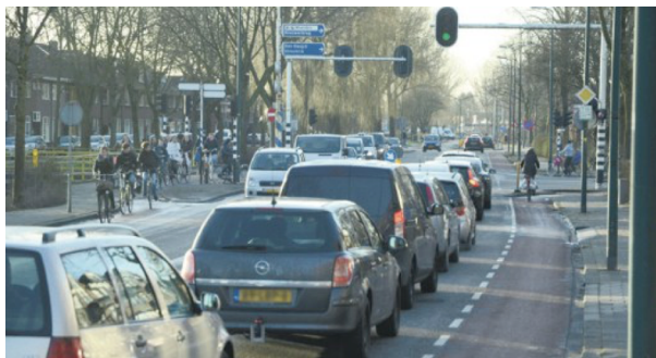
Al jarenlang niet opgepakt: files op de Boerendijk