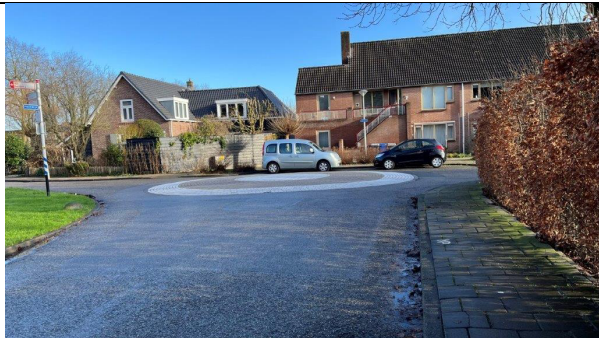
600.50-05-10-001.25 DO , deelgebied Haanwijk / Uitweg 3 (kaart 08)

Doorfietsroute rood asfalt, kruising Rijnlaan