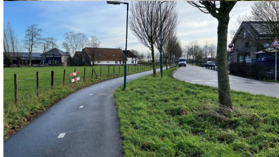
600.50-05-10-001.28 DO , deelgebied Harmelerwaard 1 (Kaart 04)

Vanaf Sportlaan aan de rechter zijde bevindt zich een bestaand fiets pad tot richting de Molenbrug.