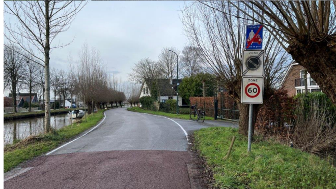
600.50-05-10-001.30 DO , deelgebied Harmelerwaard (Kaart 01)

Het tracé begint vanaf de Zandweg "Vleuterweide" in de gemeente Utrecht. De bestaande situatie richting Harmelen dat hier een 60km zone betreft met grijs asfalt.