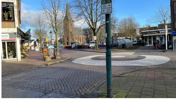
600.50-05-10-001.26 DO Kalverstraat , Uitweg (Kaart 05)

Is het juist dat deze druppel (punaise) op de hoek van Kalverstraat / Uitweg gaat verdwijnen?