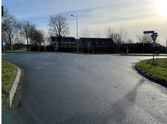
600.50-05-10-001.24 DO , deelgebied Breeveld / Haanwijk 2 (Kaart 10)

Tot aan de blauwe brug roodasfalt 30km/u