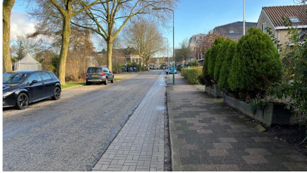
600.50-05-10-001.26 DO Uitweg (Kaart 06)

Is het juist dat deze druppel (punaise) op de hoek van Kalverstraat / Uitweg gaat verdwijnen?