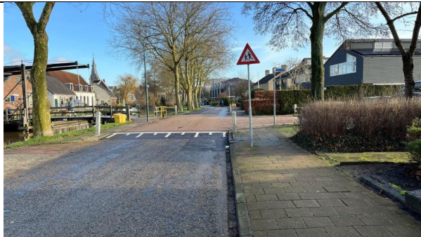
600.50-05-10-001.25 DO Haanwijk / Uitweg (Kaart 07)

Doorfietsroute rood asfalt, kruising Rijnlaan