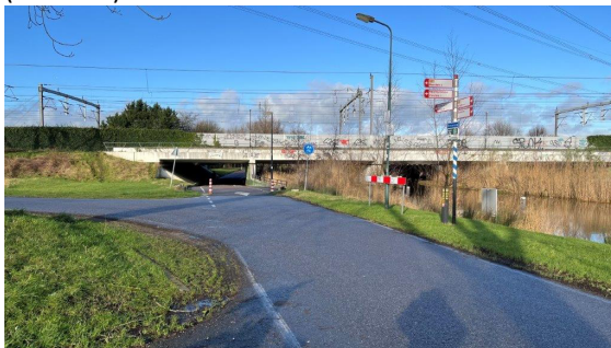
600.50-05-10-001.25 DO , deelgebied Breeveld / Haanwijk 2 (Kaart 12)

Vanaf blauwe brug richting Breeveld Blijft 60km/u en grijsasfalt met her en der drempels Bord (fiets)route F12 staat hier aangegeven, echter hier komt geen roodasfalt!