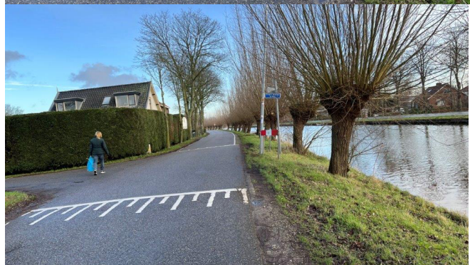
600.50-05-10-001.29 DO , deelgebied Harmelerwaard 2 (kaart 02)

De route loopt langs de Heldamweg richting de Gregor Mendelweg.